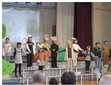
二戸市立御返地小学校