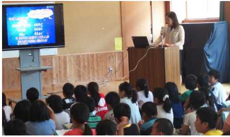
いわて地域脱炭素推進員による事前学習