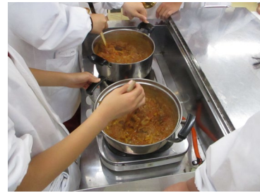
体験学習例（エコクッキング）