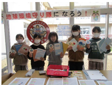
花巻市立湯口小学校